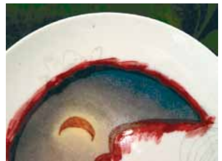
A l'aide d'un putois ou d'un tampon de mousse, je supprime cette trace.