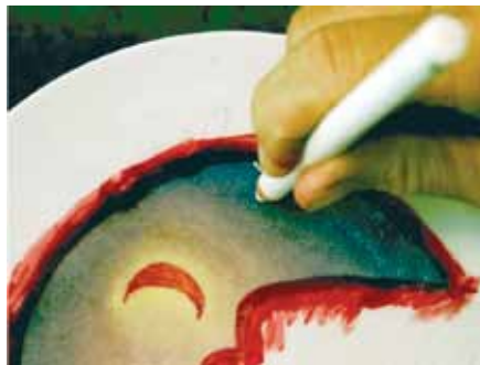
J'appuie fermement le crayon magique sur le poil