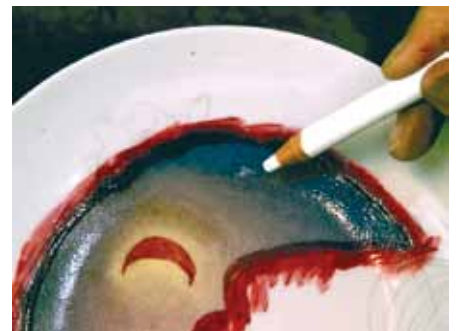
Je relève le crayon magique