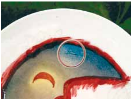
Je dois ôter ce poil avant la cuisson afin de ne pas avoir de trace

Emploi si une poussière se pose sur votre décor, collez-la avec la mine en tenant le crayon bien perpendiculaire à votre décor