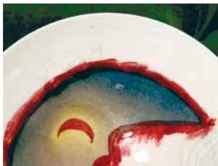
Cette opération a laissé une légère trace dans la peinture fraîche